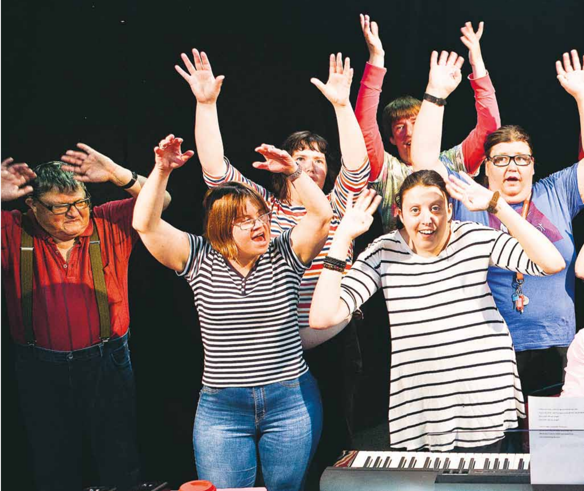
Teater Teamus bjuder i talkshowen Härligt liv på en modern och fartfylld föreställning. Gästspelet vid Stora Likarättsdagen på Malmö Arena blir teatergruppens största framträdande hittills.